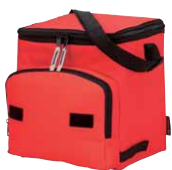
44 110 punti