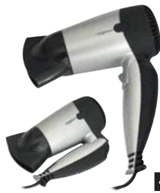
45 130 punti