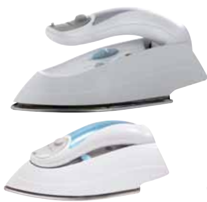
46 160 punti