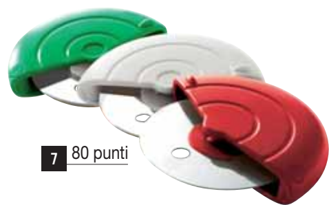
7 80 punti