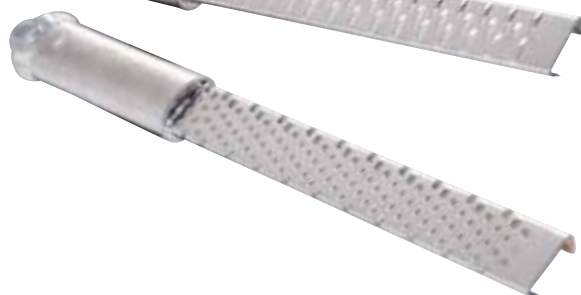
6 140 punti