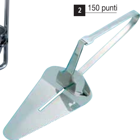
2 150 punti