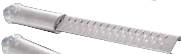
5 140 punti