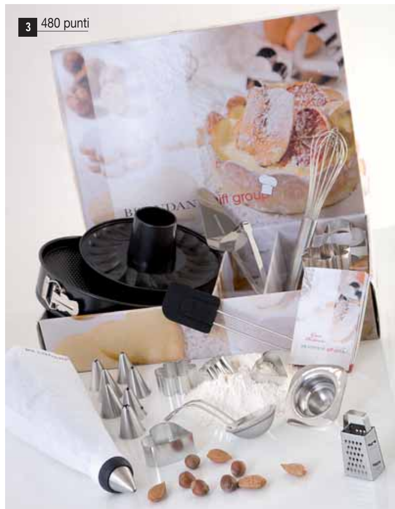
3 480 punti