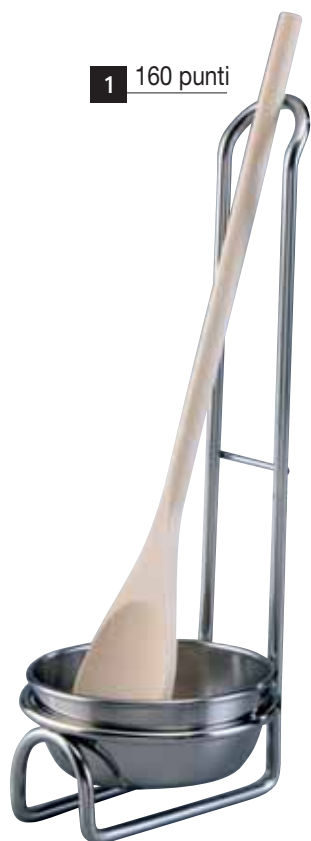
1 160 punti