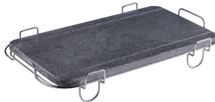
14 210 punti