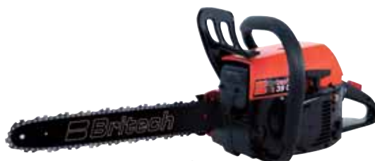
23 1.050 punti