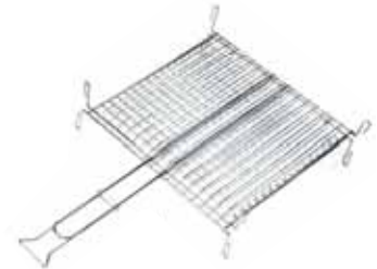
16 130 punti