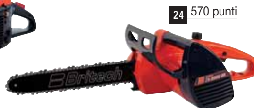
24 570 punti