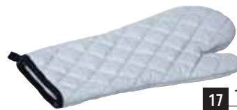
17 100 punti