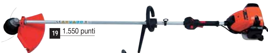
19 1.550 punti