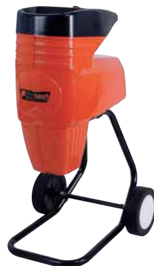
27 2.150 punti

19 Cod. GI043 1.550 punti Decespugliatore BT34GBL Sandrigarden con motore a scoppio 2 tempi, cilindrata 34 cc, potenza 1,0 Kw - 1,4 CV. Accensione elettronica, carburatore a membrana con primer. Tipo di impugnatura "Loop", diametro asta 25 mm., lunghezza asta 151 cm., cinghia di sostegno. Sporgenza massima del filo nylon testina: 42 cm., Ø massimo lama 230 mm., peso 5,9 Kg.