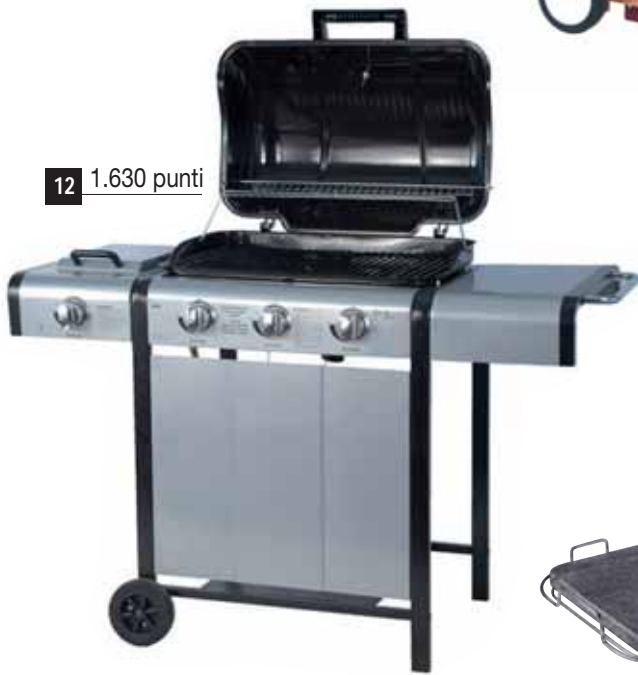
12 1.630 punti