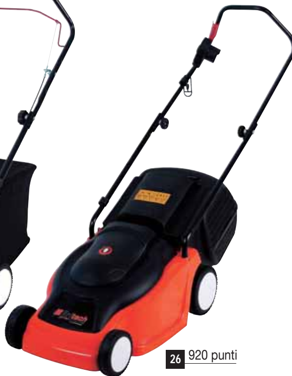
26 920 punti