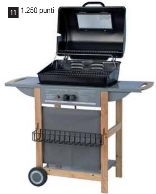
11 1.250 punti