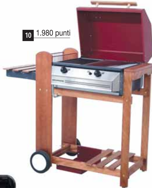
10 1.980 punti