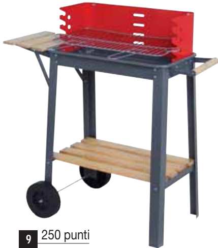
9 250 punti