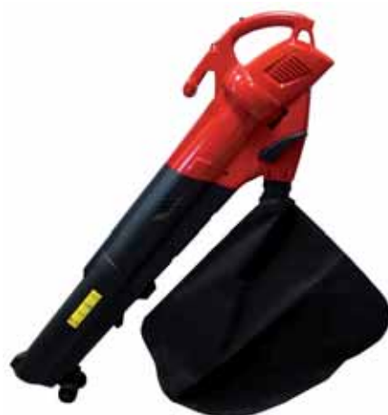
22 380 punti