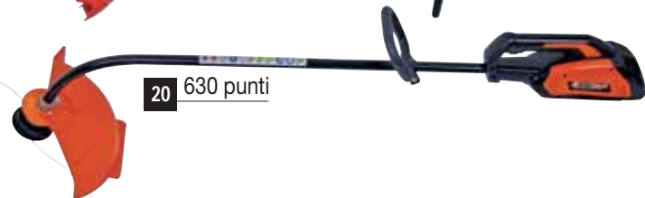
20 630 punti