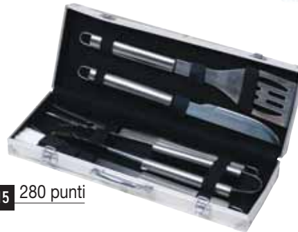
15 280 punti