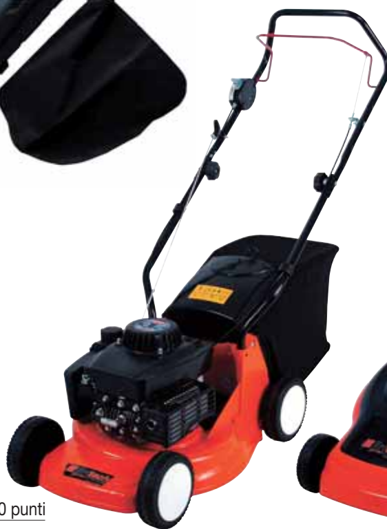
25 1.260 punti