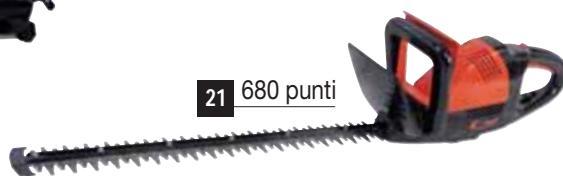
21 680 punti